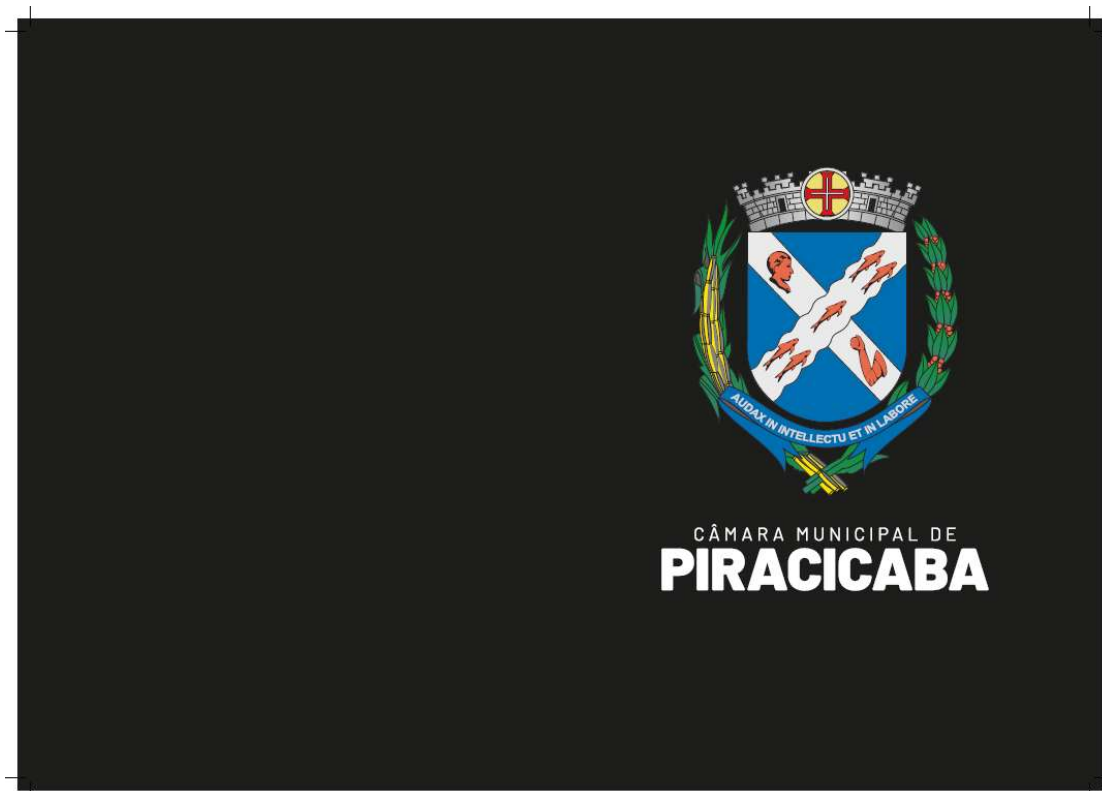
Imagem da Pasta de Moções